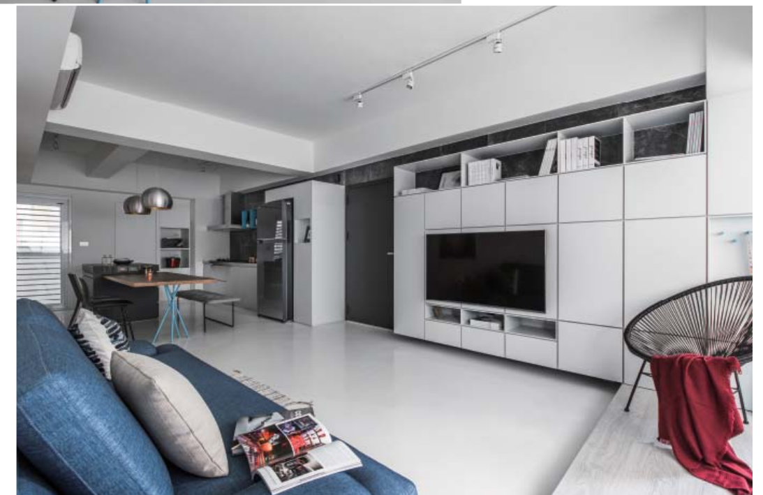
左頁·右頁：黑灰白色系的清新主軸利用活力青藍作跳色，輕鬆無壓而自在