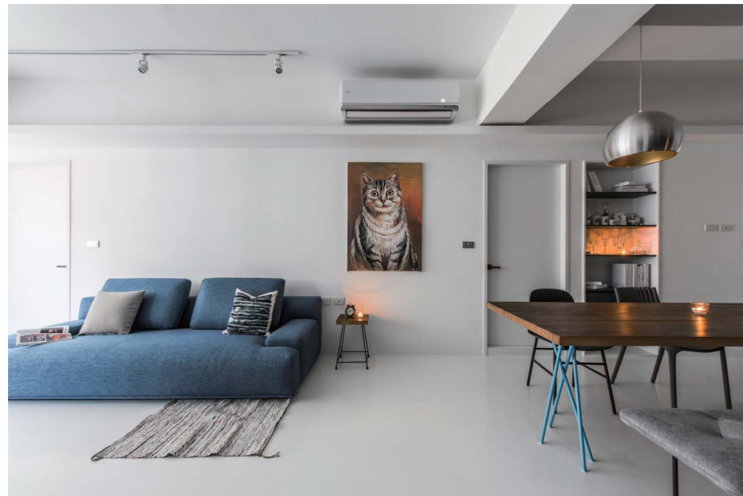
左頁·右頁：1：1公私領域配置，運用減法設計化解畸零空間