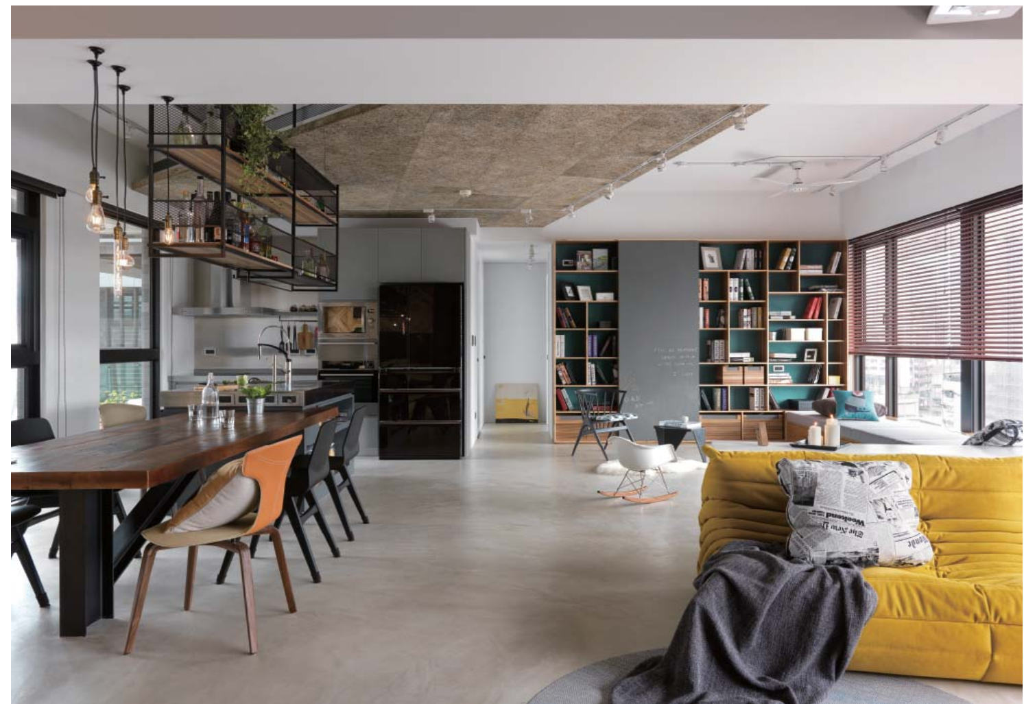
左頁：廚房調整使用方向，以便於女主人料理時看顧孩童並與家人互動 右頁：書櫃門板選漆為黑板漆，可讓幼齡孩童塗鴉玩耍