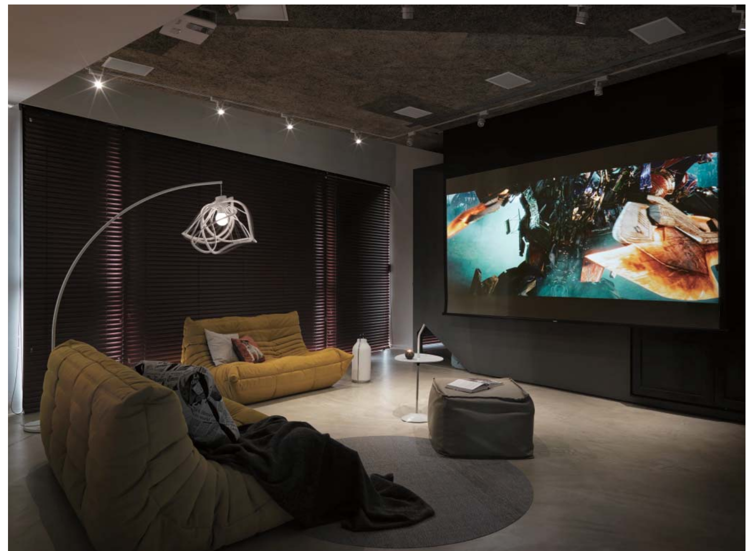
左頁：更衣間以鐵網架做分隔與層板，保持視覺通透性 右頁：天花板採用具有消音功能的鑽泥板