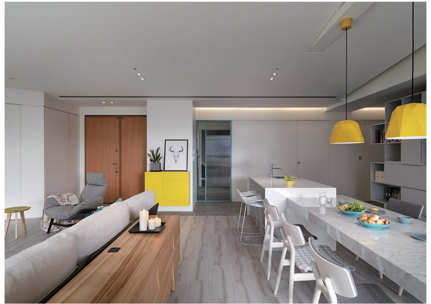
左頁：規劃部份陽台區域為陽光房讓孩童遊戲 右頁：不規則狀的天花板實際上是仿穀倉斜屋頂