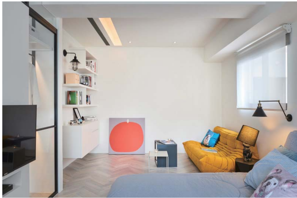
左頁：主臥室規劃一方閱讀區，可避免外界的干擾 右頁：拉直牆面，使得視覺更為平整、寬敞，採光得已穿透、延伸