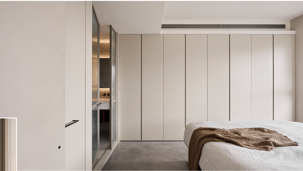
左頁・右頁：藉由對分割比例與材質搭配的拿捏，鋪墊空間層層細節